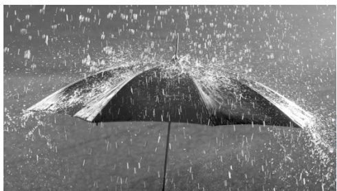
2. mauvais temps