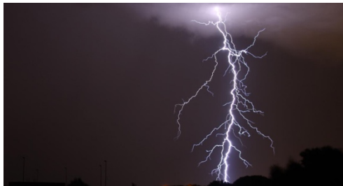
1. la foudre